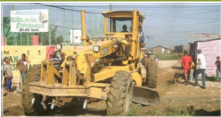
Limpieza de contenes

D ecenas de moradores del barrio Santa Lucía participaron en el segundo operativo de recolección de residuos sólidos, y de saneamiento de badenes y contenes realizado por el Ayuntamiento de Santiago y la Junta de Asociaciones Campesinas Coronel Rafael Fernández Domínguez.