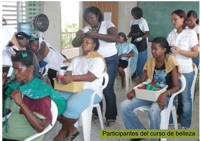
Participantes del curso de belleza