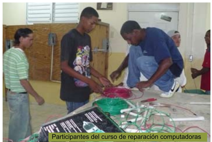
Participantes del curso de reparación computadoras