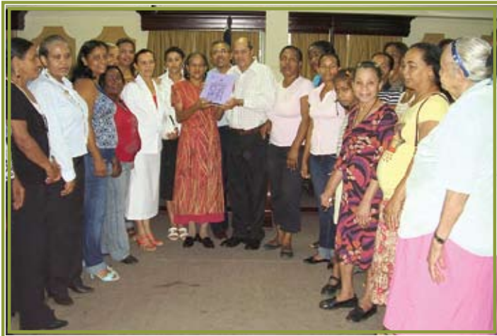
La Asociación de Mujeres Santa Rita recibe el documento de registro legal

E sta organización se funda el 22 de mayo de 1996. En sus inicios llevaba por nombre Club de Madres La Altagracia, en el año 2002 pasó a llamarse Grupo de Mujeres Santa Rita y recientemente adoptó el nombre definitivo de Asociación de Mujeres Santa Rita. El cambio de nombre se debe a que la Altagracia es muy usado para grupos y organizaciones.