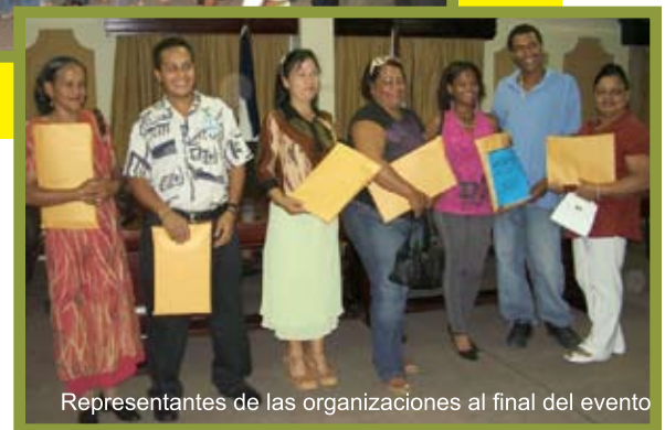
Representantes de las organizaciones al final del evento