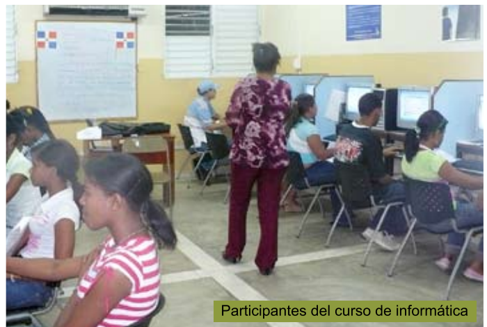
Participantes del curso de informática