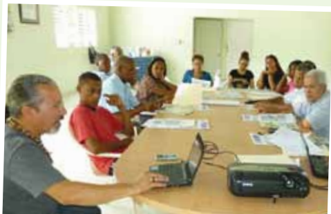
Villa González. Alianza para el Desarrollo / Asociación de Agentes de Desarrollo.