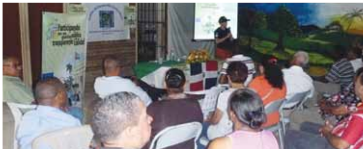
Hoya del Caimito, Santiago. CODESNOR.