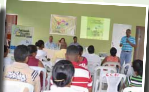
Santiago. Consejo de Desarrollo Santa Lucía.