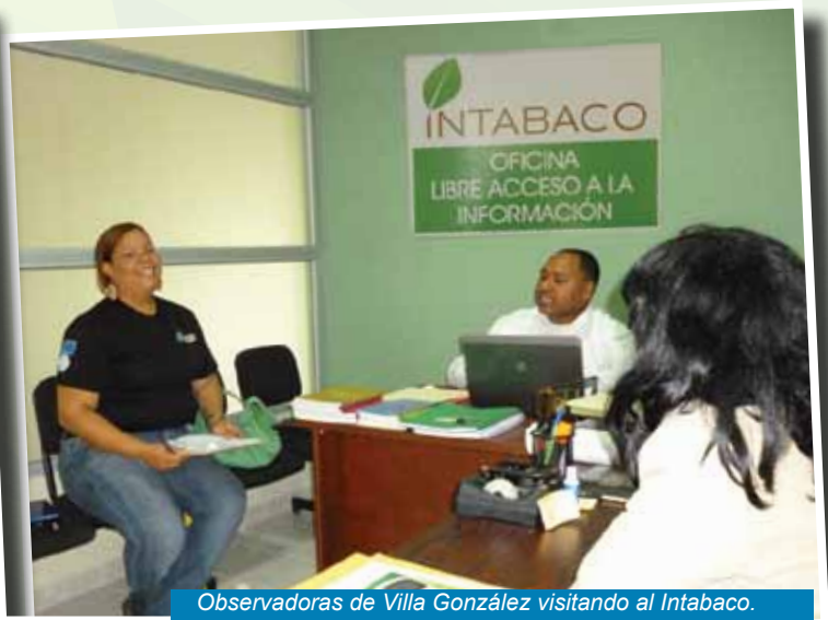
Observadoras de Villa González visitando al Intabaco.