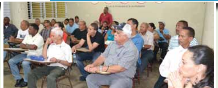
Zona sur de Santiago. CODOSUR.