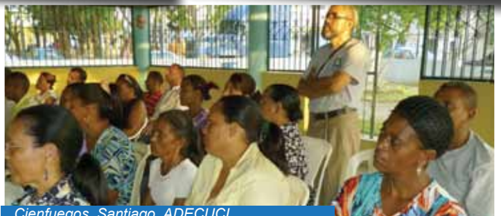
Cienfuegos, Santiago. ADECUCI.