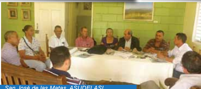
San José de las Matas. ASUDELASI.