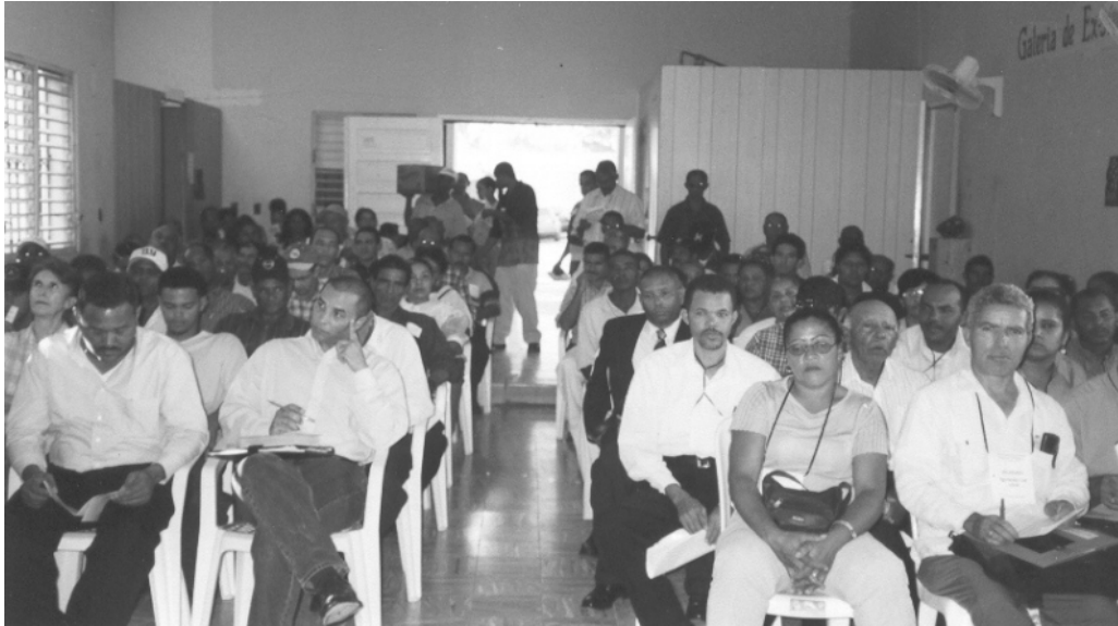
Vista parcial de los asistentes al encuentro de definición del Presupuesto Municipal Participativo de Villa González para el año 2003.

FUNDACION SOLIDARIDAD — SANTIAGO R. D. — No. 31, MARZO 2003