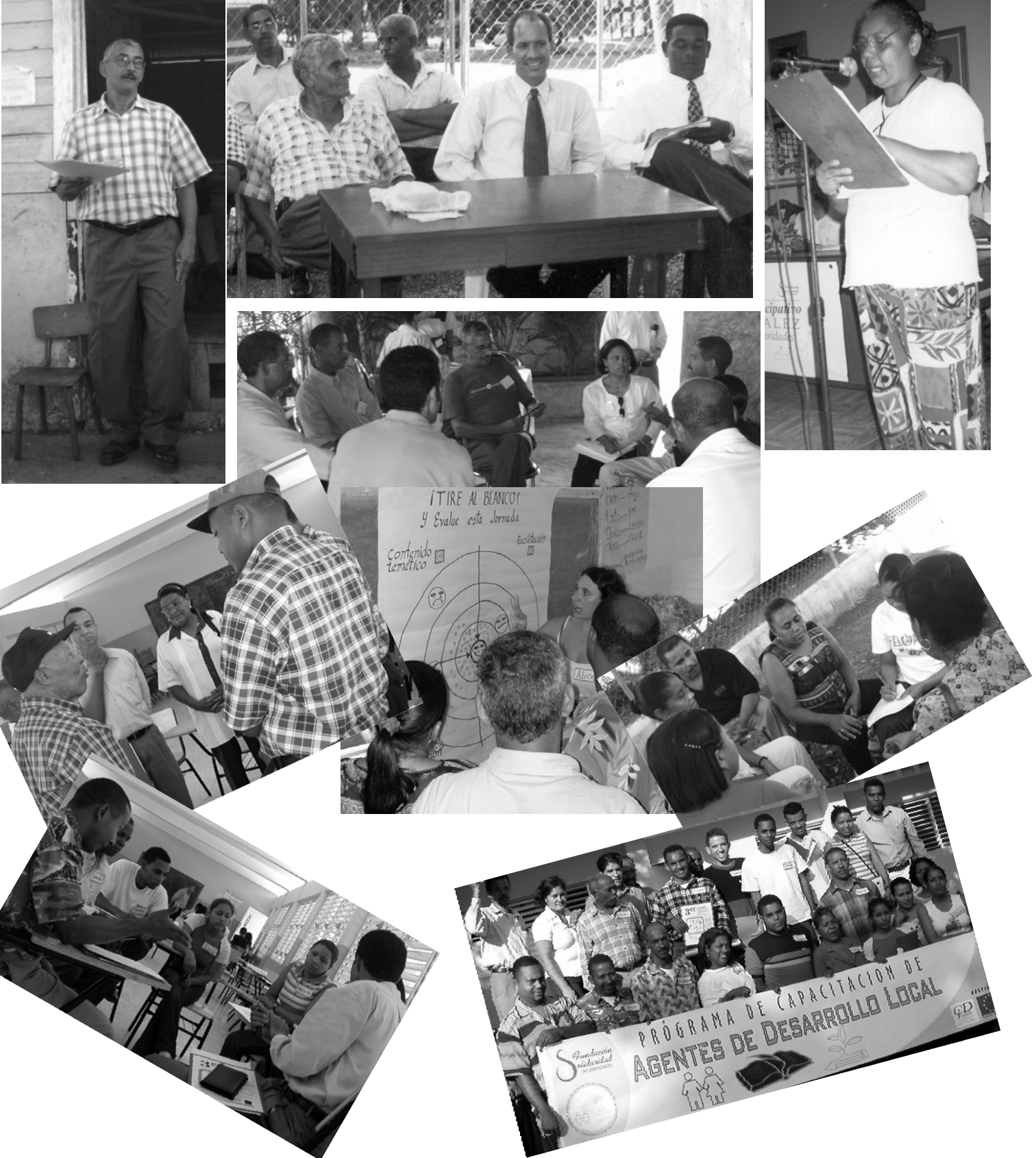
Galería de fotografías de diferentes actividades realizadas en el municipio de Villa González en el marco de los proyectos que la Fundación Solidaridad desarrolla en esa zona.