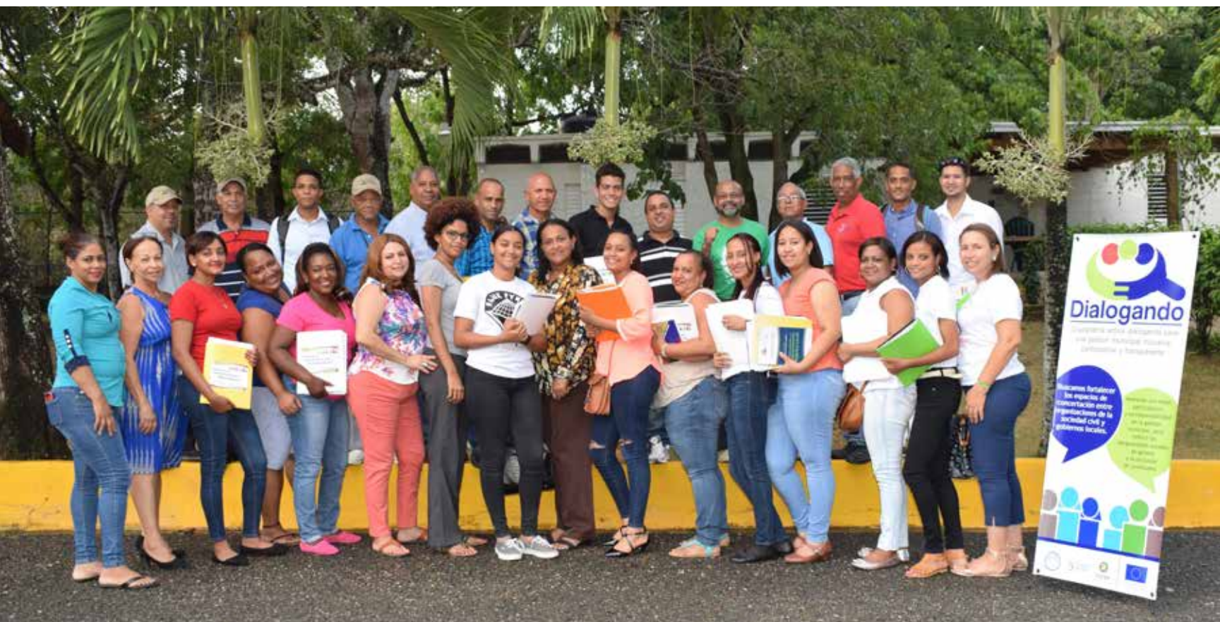
Veedoras y veedores participantes en taller realizado en Santiago los días 7, 8 y 9 de septiembre de 2018

Los y las participantes recibieron retroalimentación de los procesos y contenidos trabajados por el proyecto Ciudadanía Activa en el uso del Sistema de Monitoreo a la Administración Pública (SISMAP/Municipal) y del Sistema de Monitoreo Ciudadano a la Administración Pública Municipal (SIMCAP), así como un entrenamiento práctico con las herramientas para el levantamiento de información y para la realización de los talleres réplicas en los municipios.