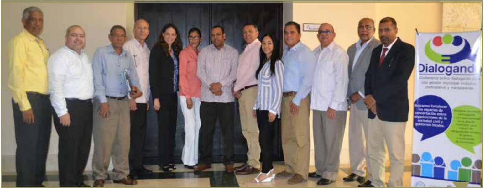
Autoridades locales participantes en el encuentro junto a técnicos de FEDOMU y Fundación Solidaridad.

A lcaldes de los municipios de la Provincia de Santiago participaron en un encuentro en el que conocieron detalles del Proyecto “Ciudadanía activa dialogando para una gestión municipal inclusiva, participativa y transparente”.