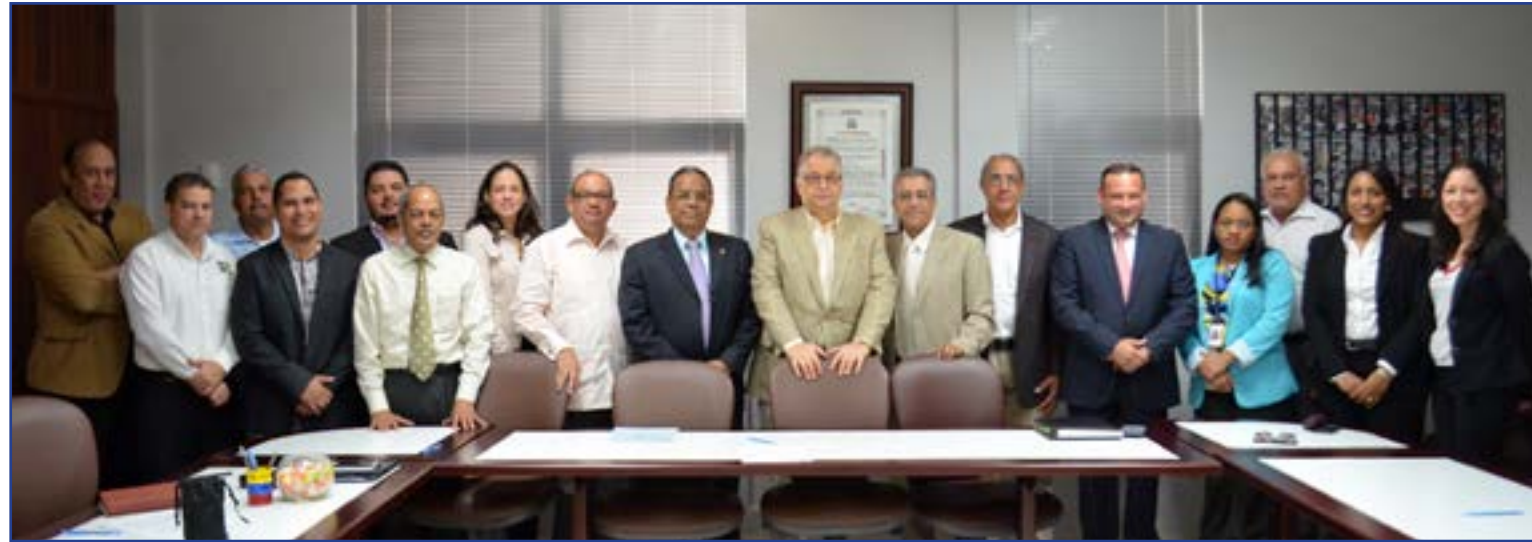
Las instituciones de la ciudad llamadas a ofrecer informaciones para el levantamiento de los indicadores, suscribieron una Carta Compromiso al inicio de la segunda fase.

El Banco Interamericano de Desarrollo (BID) impulsa en América Latina, la iniciativa de Ciudades Emergentes y Sostenibles (ICES), y con el aval del Ministerio de Economía, Planificación y Desarrollo (MEPyD), trabaja armónicamente con el Ayuntamiento del Municipio y el Consejo para el Desarrollo Estratégico (CDES), en la puesta en operación de esta iniciativa en la ciudad de Santiago de los Caballeros y su entorno metropolitano.