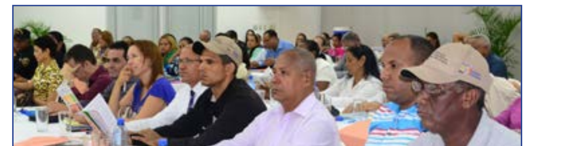
En las imágenes varios momentos del seminario ¿Hacia dónde van los ayuntamientos dominicanos?

Entre las principales conclusiones del evento figuran la necesidad de establecer un diálogo franco y permanente entre el gobierno central, las autoridades locales y las organizaciones de la sociedad civil; transferir mayores recursos y competencias desde el gobierno central hacia los ayuntamientos que permitan afrontar las necesidades de los territorios; fortalecimiento de los mecanismos