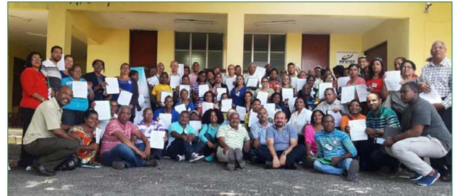
Delegados de 500 organizaciones comunitarias y sociales de 40 municipios de la República Dominicana, constituyeron el espacio de articulación Red Nacional por la Transparencia Municipal.

En Asamblea Constitutiva los días 9, 10 y 11 de septiembre 2016, la Red Nacional por la Transparencia Municipal aprobó sus documentos fundamentales: su naturaleza municipalista, la declaración de principios, los objetivos y el nombre, así como la conformación de su estructura, al tiempo de integrar los roles de la misma.