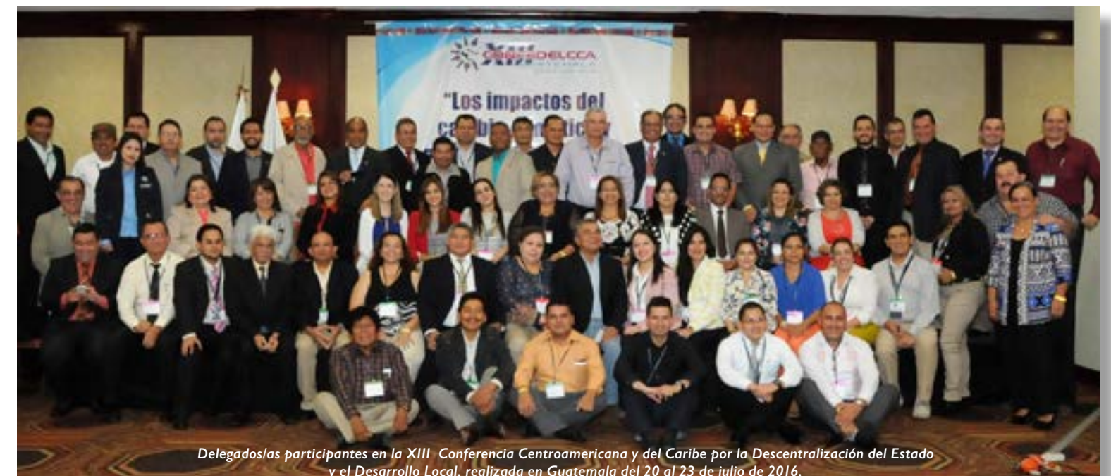
Delegados/as participantes en la XIII Conferencia Centroamericana y del Caribe por la Descentralización del Estado y el Desarrollo Local, realizada en Guatemala del 20 al 23 de julio de 2016.

que fueron: El crecimiento sostenible en América Latina y el Caribe ¿Hacia dónde vamos?; El uso de la innovación y su impacto en el crecimiento sostenible; Los efectos del cambio climático, los planes de mitigación y su impacto en el crecimiento sostenible; Equidad e Incentivos Fiscales para el crecimiento sostenible y la Seguridad Vial, su impacto en la Salud Pública y el crecimiento sostenible.